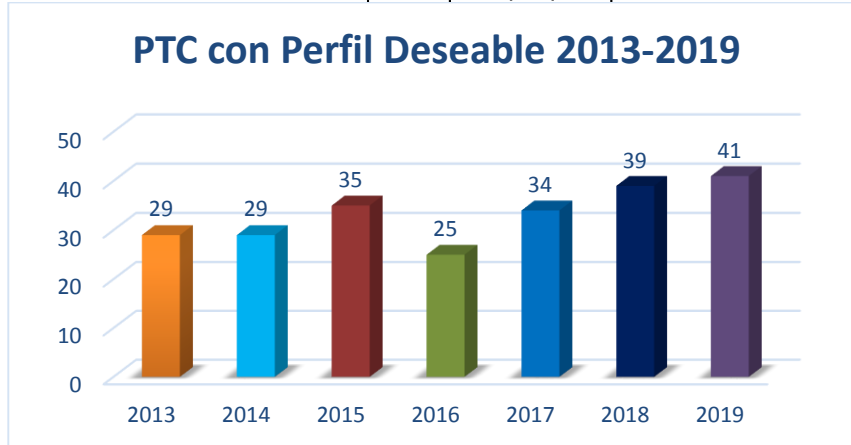
Evolución de los Profesores de Tiempo Completo (PTC) con perfil deseable 2013-2019

Fuente: Departamento de Gestión Académica, UNISTMO 2019.