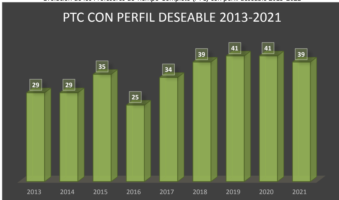
Evolución de los Profesores de Tiempo Completo (PTC) con perfil deseable 2013-2021

Fuente: Departamento de Gestión Académica, UNISTMO 2021, con corte al 30 de junio de 2021.